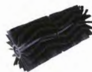
BROSSE CENTRALE PPL STANDARD (512) SPPV76060 - (712) SPPV76062