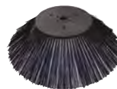
BALAI LATÉRAL PPL STANDARD SPPV76057