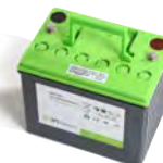
BATTERIE GEL X 1 (512 ET) BAAC00105