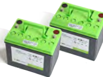
BATTERIE GEL X 2 (712) BAAC00105